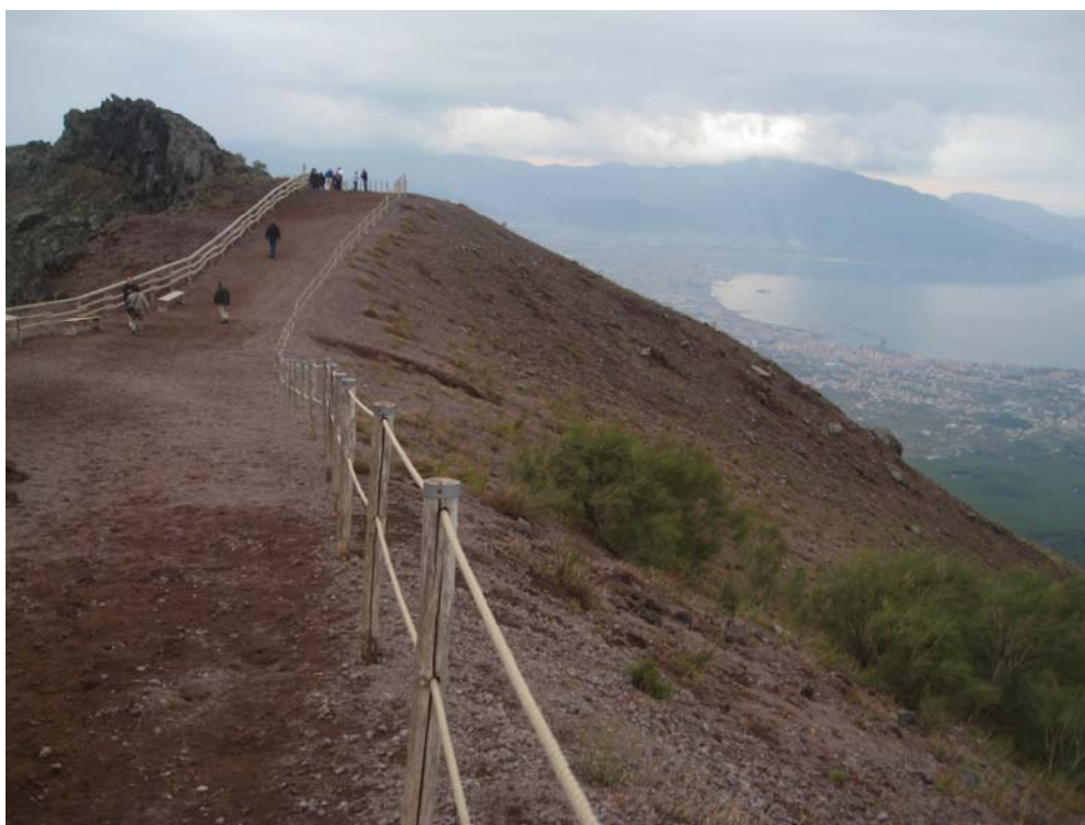
Граница между внешним миром неаполитанского залива и ужасно-прекрасным внутренним миром кратера. Отсюда просматриваются и Помпеи и на северо-западе - на самом краю залива - мыс Мизено, место стоянки кораблей адмирала Плиния.