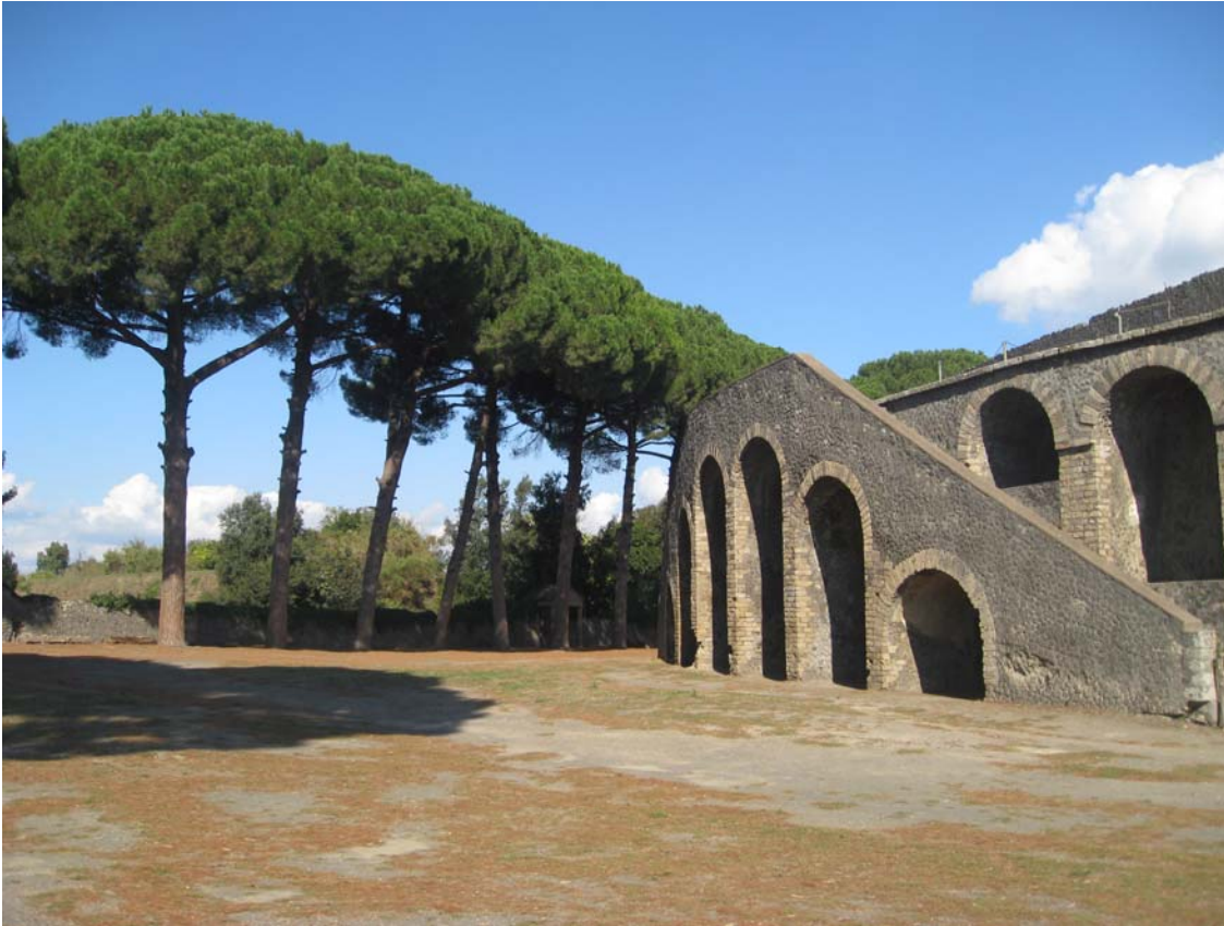
«Изгородь» пиний в античных Помпеях.

Удивительно, что и фонетическое совпадение слов «пиния» и «Плиний» практически стопроцентное. Бродский просто не мог не услышать его и не использовать для моментально запоминающейся, и абсолютно музыкальной рифмы. Я же был настолько очарован помпейскими пиниями, что, увидев на карте города «Via Plinio», машинально пропустил букву «L», ошибочно «переименовав» «Улицу Плиния» в «Улицу пиний».