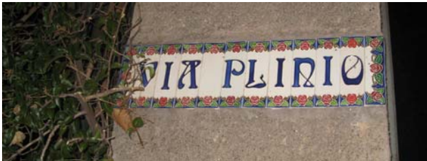
Улица Плиния. В кадр попала и знаменитая помпейская собака.

Но мы уже должны «возвращаться» от очарования пиний и Виа Плиния к ужасу плиннианского извержения Везувия и рассказу Плиния Младшего о нём, но, главное - о мужестве Плиния Старшего: