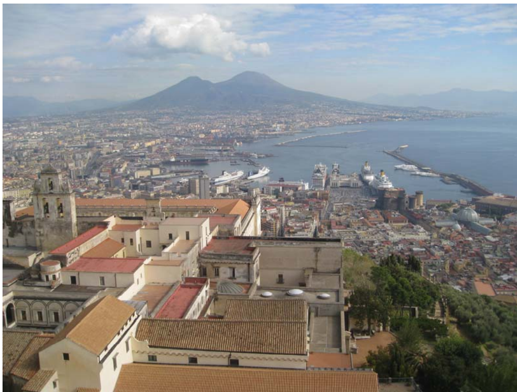
Вид на Неаполитанский залив и Везувий с крыши Замка святого Эльма.