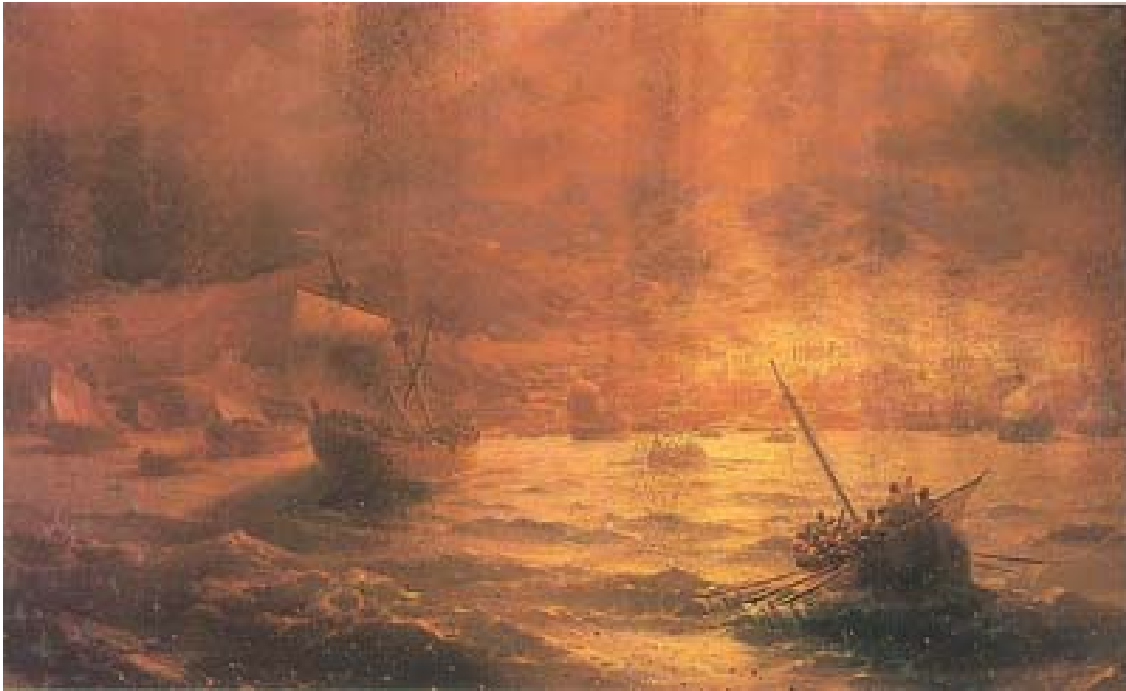
И. К. Айвазовский. «Гибель Помпеи», 1889 г. Не так ли сквозь "потоки огня" прорывались к "недоступному" берегу кватриремы Плиния Старшего?

Уже на корабли падал пепел, более густой и более горячий по мере того, как приближались [к берегу]; уже падали куски пемзы и черные, обожженные и потрескавшиеся от силы огня камни. Море внезапно обмелело, и берега стали недоступны, загроможденные обломками горы. Поколебавшись один момент, не повернуть ли ему назад, - да и кормчий советовал ему это сделать, - он тотчас приказывает ему: "Смелым счастье - покров и защита, правь к Помпониану". 12 Он был в Стабиях, в местности, отделенной небольшим заливом, так как море катило здесь свои волны, вдаваясь внутрь материка мягким изгибом. Сюда, так как опасность еще не была близкой, но уже была видимой и по мере усиления могла наступить очень скоро, Помпониан тревогой собрал на корабли свою команду, готовый бежать, как только спадет противный ветер. Но для моего дяди он был очень благоприятным: пользуясь им, он подплыл сюда, обнял своего трепещущего друга, утешает, уговаривает его; и чтобы успокоить его страх своим спокойствием, велит нести себя в баню? Он вымылся, возлег на ложе, стал обедать, был веселым или, что в равной мере указывает на величие его души, казался веселым.