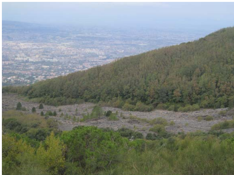
Лавовый поток извержения 1944 г. Фото автора.

Google-карта Везувия (воспроизведено с сайта www.pompeii.ru ). А – сохранившаяся часть дугообразного конуса Монте-Сомма. В – основной конус с кратером. Впадина между А и В называется Долиной Гиганта. Буквой С обозначен лавовый поток извержения 1944 г.